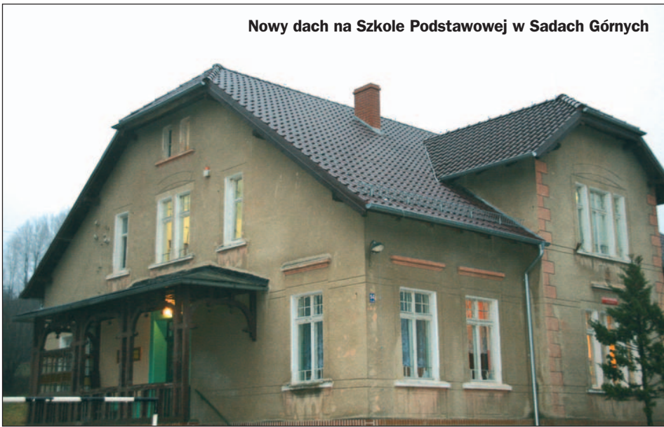
Nowy dach na Szkole Podstawowej w Sadach Górnych

boisku szkolnym. Remont gabinetu pielęgniarek i siłowni w budynku szkoły. Razem : 39.251,16 zł.