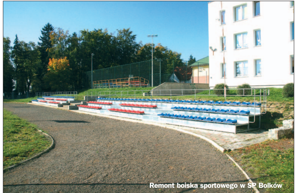
Remont boiska sportowego w SP Bolków

8. Szkoła Podstawowa w Bolkowie - odwodnienie bieżni, montaż piłkochwytu, demontaż starych i montaż nowych trybun, niwelacja terenu i ułożenie kostki brukowej - na